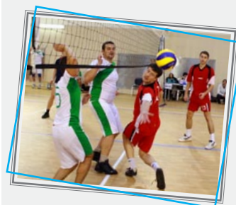
Во время матча SoftClub – EPAM Systems царили нештучные страсти