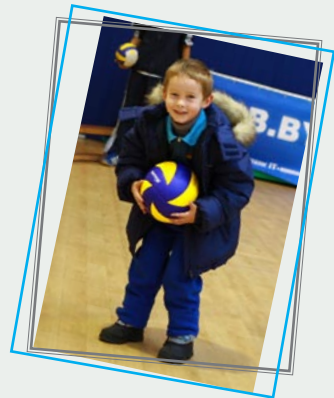
Юный болельщик ИТ-Спартакиады! Волейболистам растет достойная смена.

31 октября в спорткомплексе «Динамо» (ул. Даумана, 23, район Комсомольского озера) состоятся первые игры турнира по мини-футболу 6 Республиканской ИТ-Спартакиады. Это один из старейших спорткомплексов города Минска, который включает в себя: крытый легкоатлетический манеж размером 140 х 36 метров; специализированный зал фехтования; зал художественной гимнастики, который в свое время являлся основным местом подготовки спортсменов национальной сборной команды по художественной гимнастике к Олимпийским играм 2008 года в Пекине; велобазу; гребную базу; открытые теннисные корты, где могут заниматься не только спортсмены и любители этого вида спорта, но и все желающие. В футбольном зале, в котором непосредственно встретятся участники 6 ИТ-Спартакиады, много света и воздуха. Болельщикам будет удобно наблюдать за играми с трибун СК «Динамо».